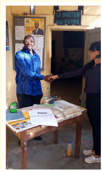
Le bureau d'un directeur d'école primaire à Conakry